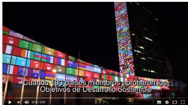
La Cumbre de Desarrollo Sostenible de la ONU: 17 Objetivos para transformar nuestro mundo

Conoce de manera más visual y dinámica los Objetivos de Desarrollo Sostenible (ODS) a través de: