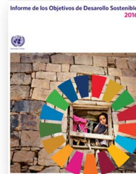
Primer informe de Naciones Unidas sobre ODS (2016)

UNESCO Etxea - Centro UNESCO del País Vasco