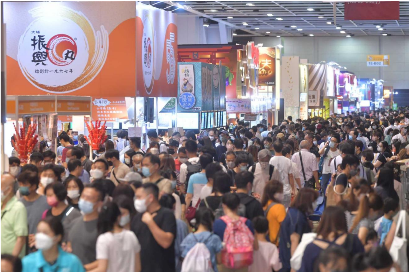
Imagen de la página web de la HKTDC Food Expo.

La feria contó con alrededor de 650 puestos, en una superficie de 26.300 metros cuadrados, contando con más de 430.000 asistentes.