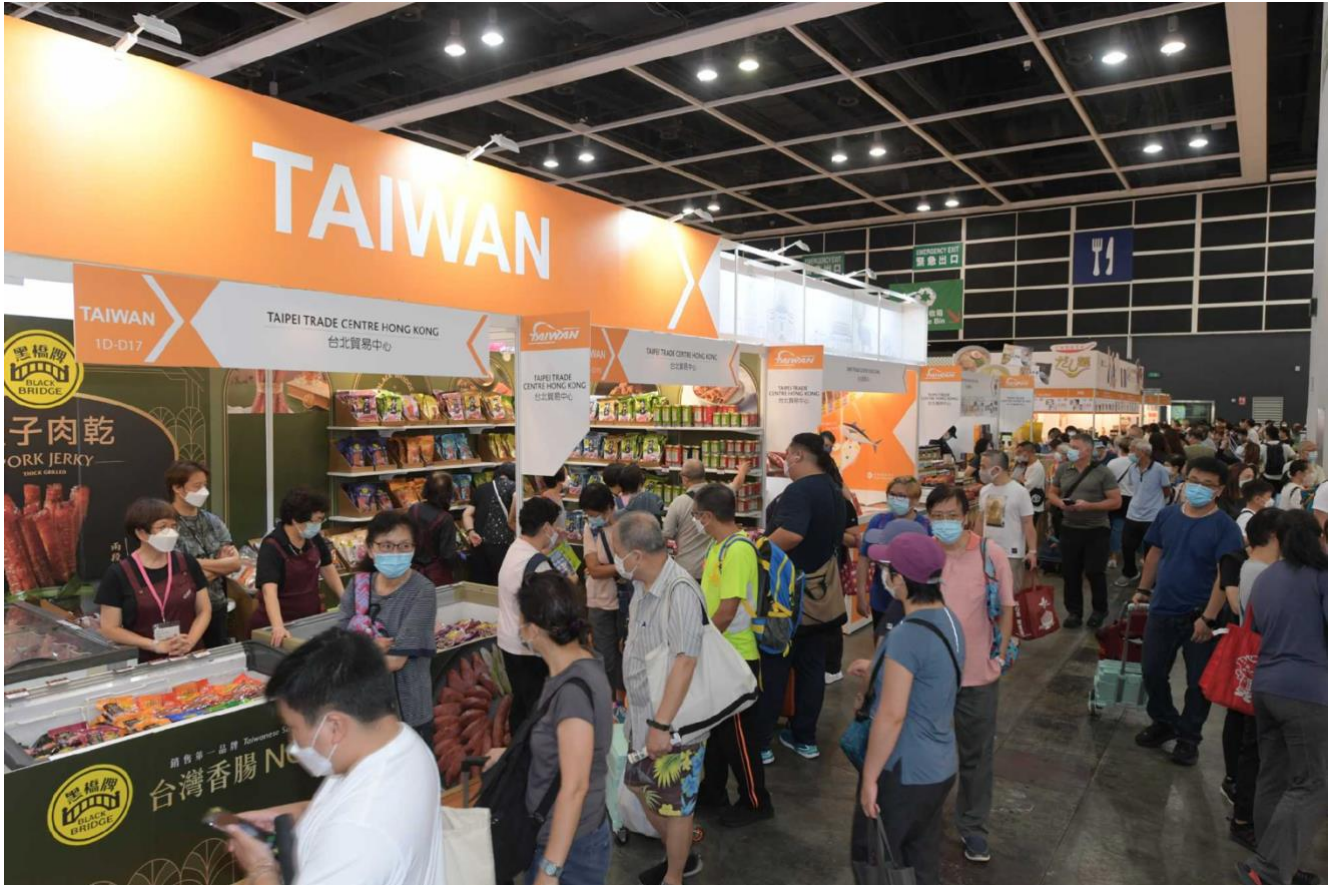
Expositor de la representación comercial de Taiwán en Hong Kong.