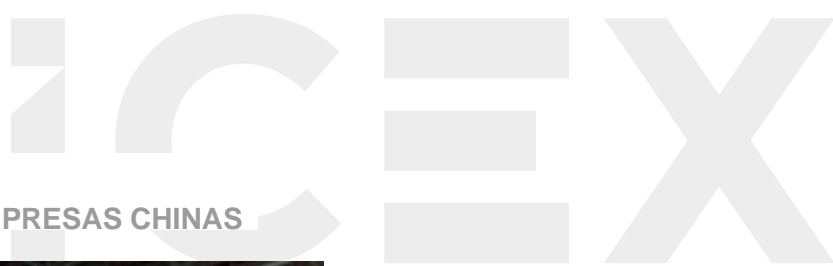
FOTOGRAFÍA IV. PABELLÓN DE EMPRESAS CHINAS