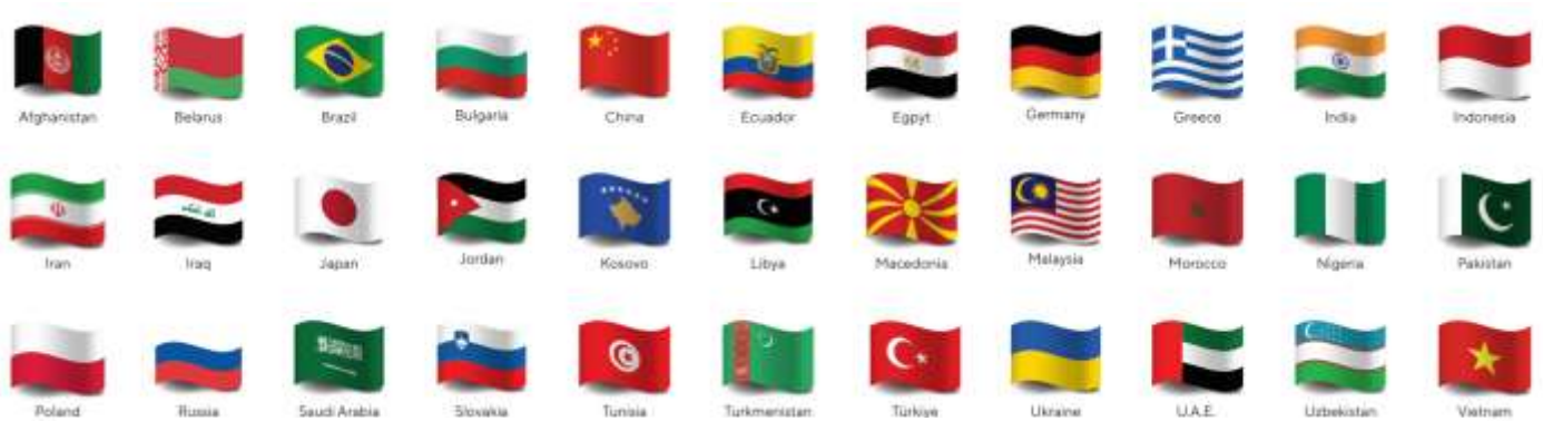
INFOGRAFÍA 1. PAÍSES DE ORIGEN DE LOS EXPOSITORES.