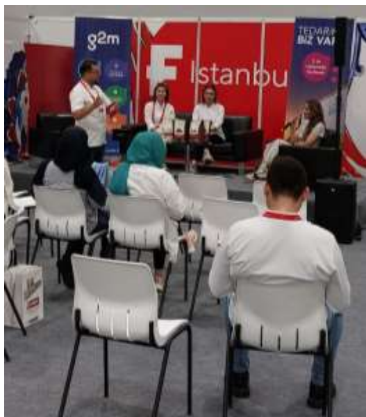
FOTOGRAFÍA I. ESPACIO DE CONFERENCIAS DE LA FERIA