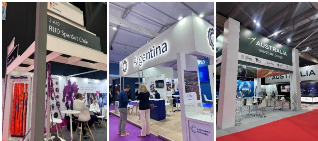
FIGURA 2. PABELLÓN ALEMANIA, ARGENTINA Y AUSTRALIA