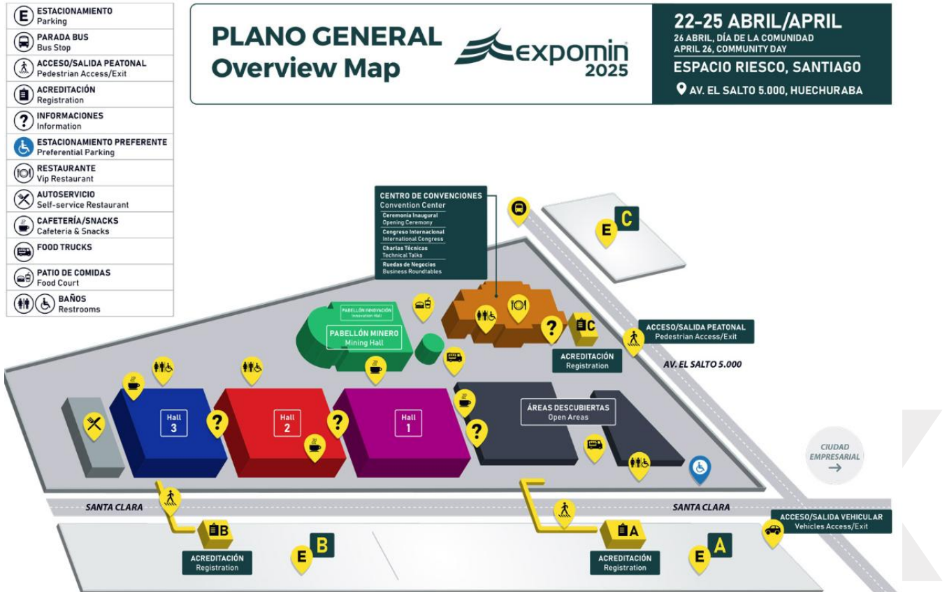
FIGURA 1: PLANO GENERAL EXPOMIN 2025