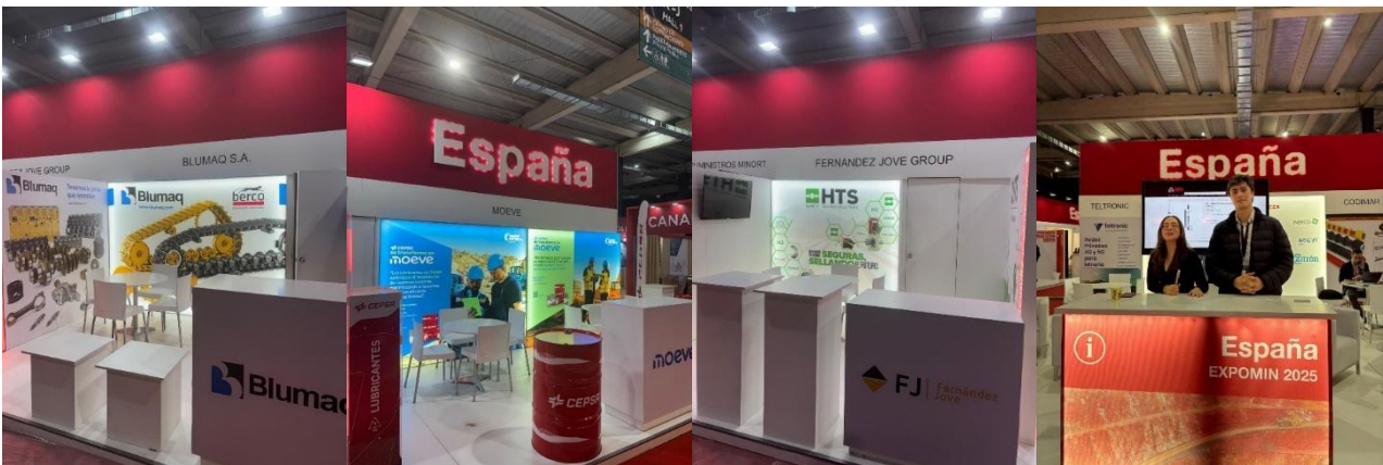
FIGURA 10. EJEMPLOS STANDS DEL PABELLÓN ESPAÑA