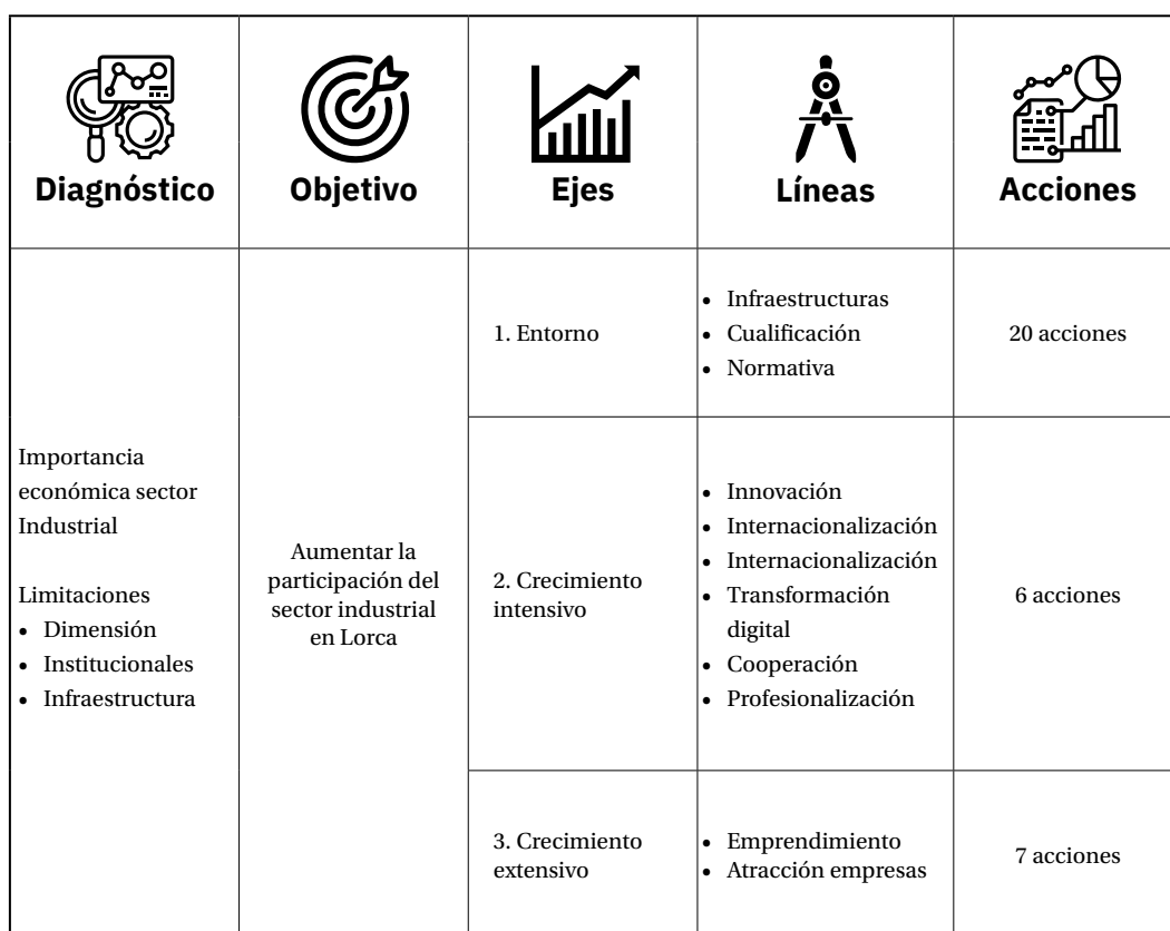
Figura 2: Esquema del análisis y bases de las propuestas de acción

El esquema del trabajo queda recogido en la siguiente figura.