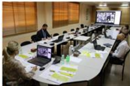
Nota-Polo+Gobierno (El Gobierno Regional Refinancia El Apoyo A Las Empresas Ante El Doble Desafío Del Brexit Y Del Coronavirus) - 16/09/2020 10:00:00

La Consejería de Empresa, Industria y Portavocía, a través del Instituto de Fomento (INFO), habrá destinado desde abril a septiembre unos 18 millones de euros en subvenciones a empresas regionales para afrontar el doble desafío de la pandemia del Brexit que, como se expuso en la reunión del Comité CAEM-Brexit celebrada martes, podría tener especial incidencia en el tejido empresarial murciano.