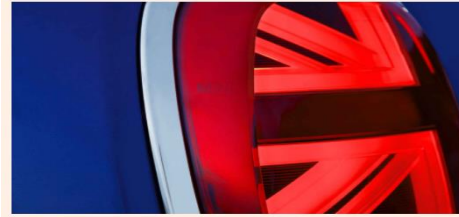
Imagen de la bandera de Reino Unido en el faro de un coche.

Directo Vea el debate de los Presupuestos Generales del Estado en el Congreso de los Diputados