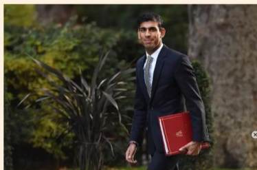
El ministro de Finanzas británico Rishi Sunak.