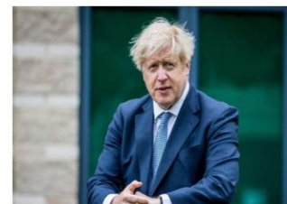
Boris Johnson primer ministro de Reino Unido.

No hay suficiente capacidad y los precios se están disparando