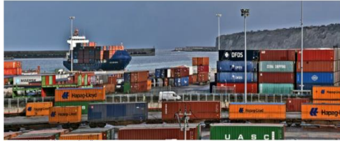
Contenedores en el puerto de Bilbao.

LOGÍSTICA PROFESIONAL | Martes, 17 de noviembre de 2020, 20:43