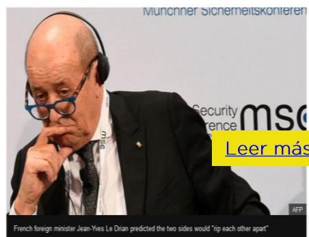
French foreign minister Jean-Yves Le Drian predicted the two sides would "rip each other apart"