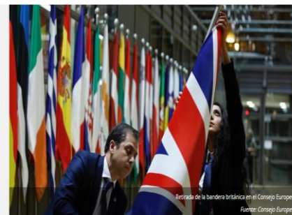
Retiro de la bandera británica en el Congreso Europeo.