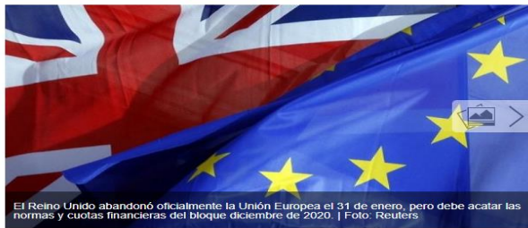
El Reino Unido abandonó oficialmente la Unión Europea el 31 de enero, pero debe acatar las normas y cuotas financieras del bloque diciembre de 2020.