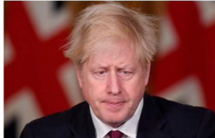
Boris Johnson, en la rueda de prensa para anunciar el confinamiento.

La avalancha de catástrofes puede hundir el PIB durante cinco años