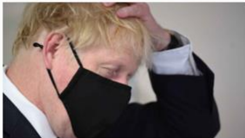
El primer ministro del Reino Unido, Boris Johnson.