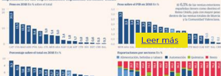
Exposición de las exportaciones españolas en Reino Unido

El 1.5% de la riqueza española depende de las ventas a Reino Unido