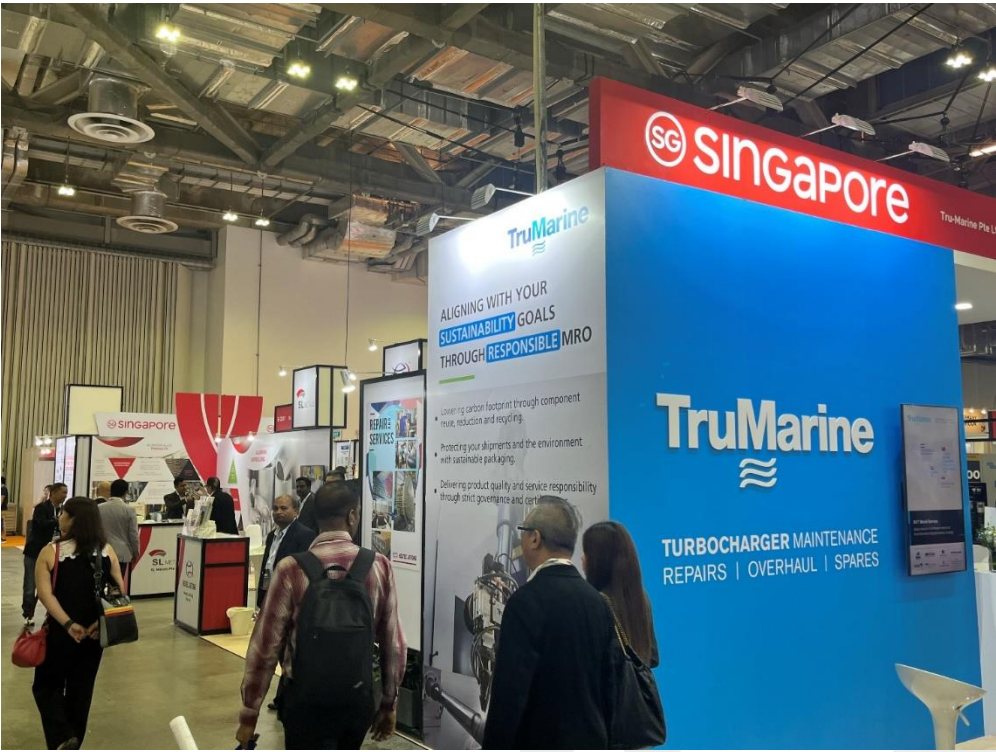
Estand de TruMarine en Pabellón SINGAPUR.