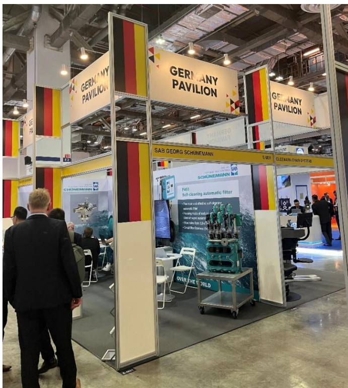
Pabellón de Alemania.