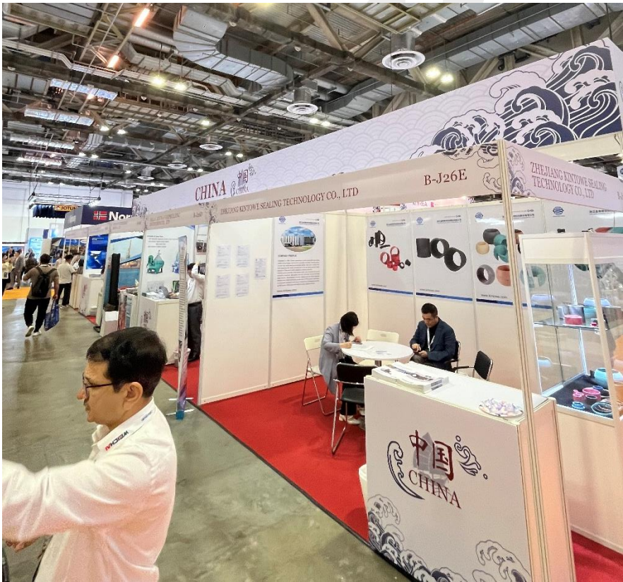
Pabellón de China.