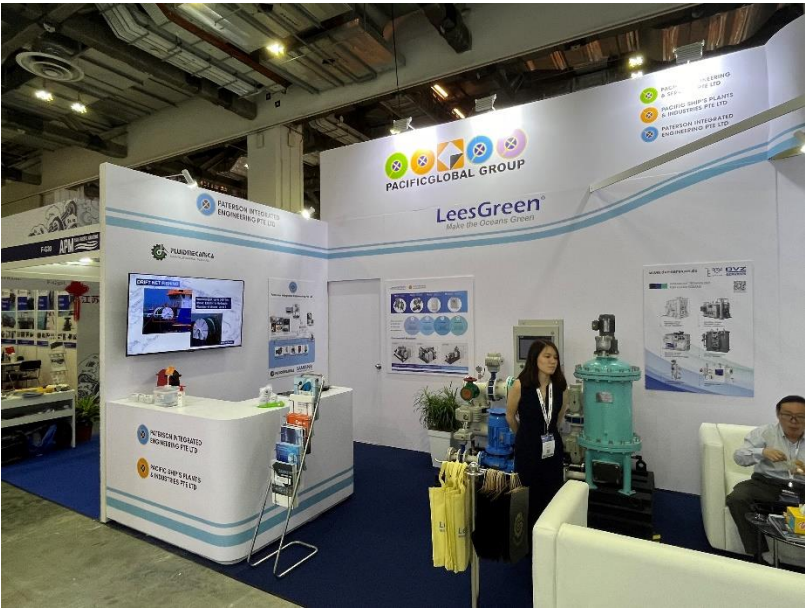
Estand de FLUIDMECANICA en espacio de PACIFIC GLOBAL GROUP.