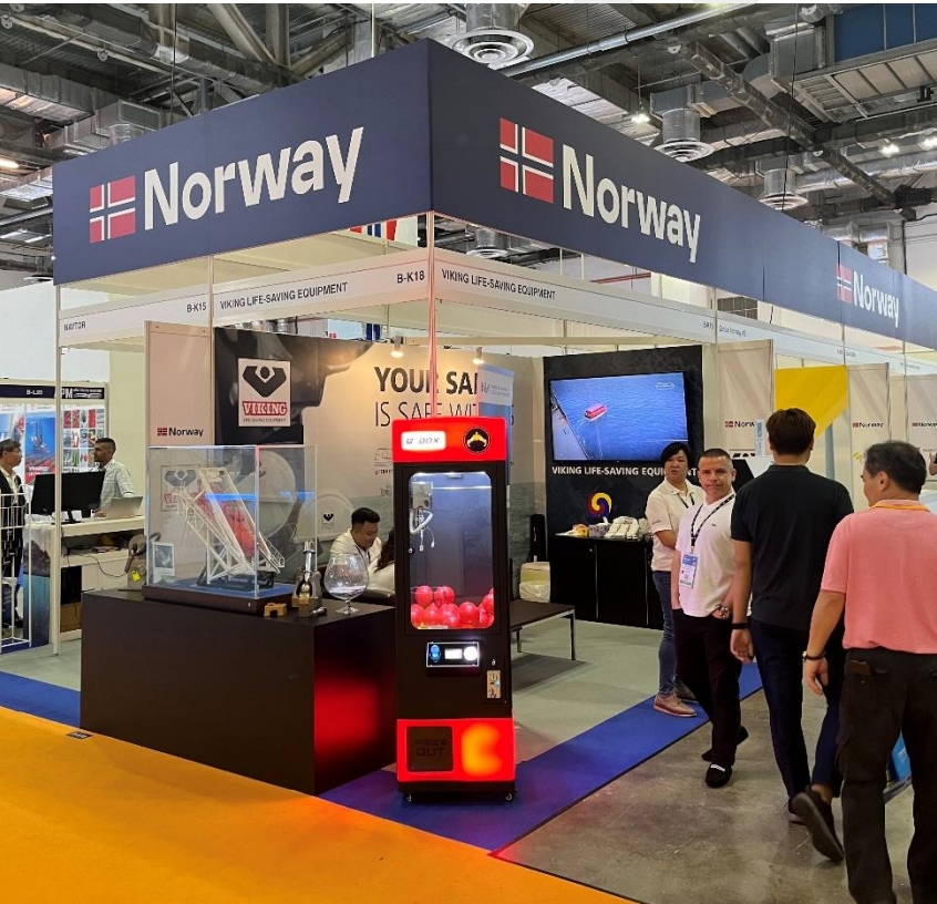
Pabellón de Noruega.