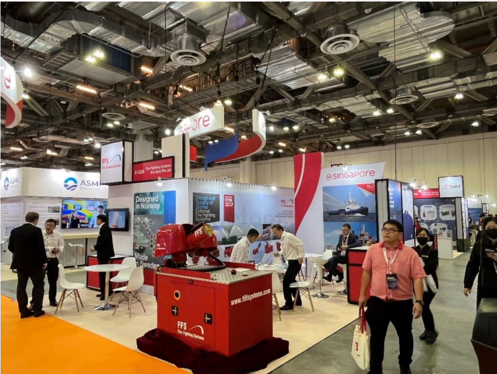
Pabellón de Singapur.