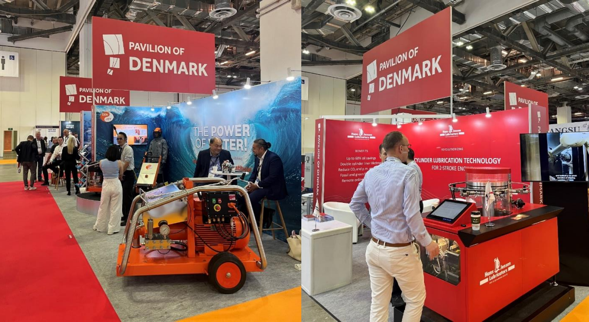
Pabellón de Dinamarca.