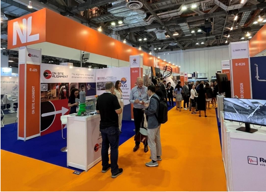
Pabellón de Países Bajos.