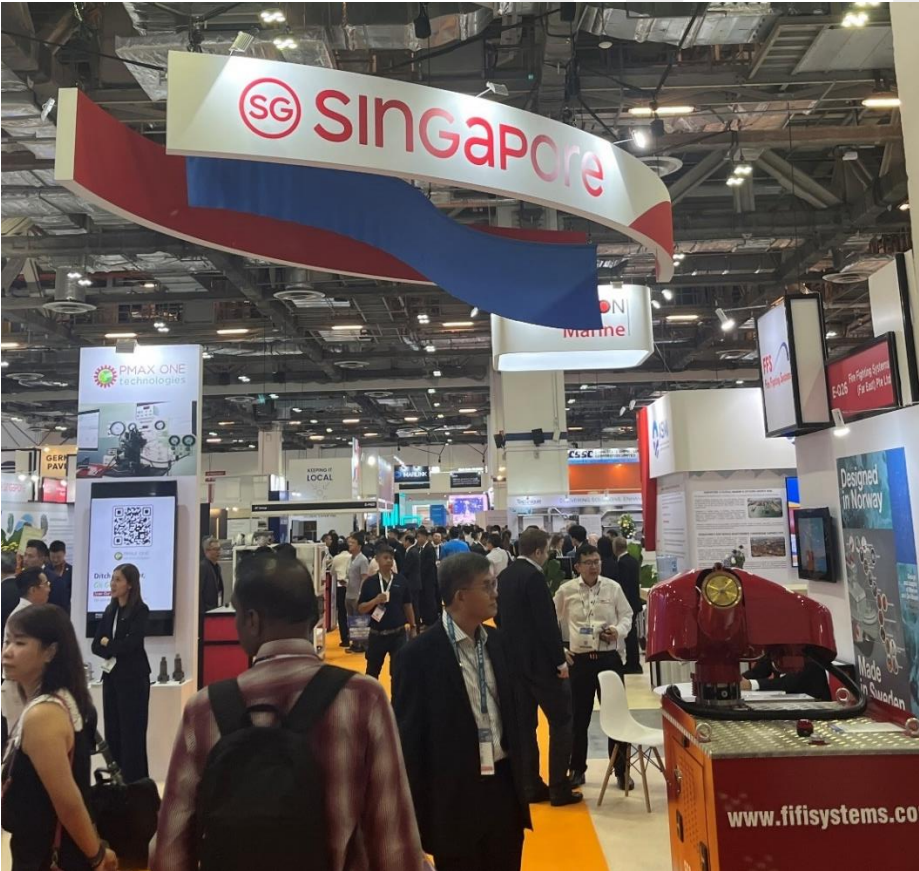
Centro del pasillo principal del Sótano 2 el primer día de feria.