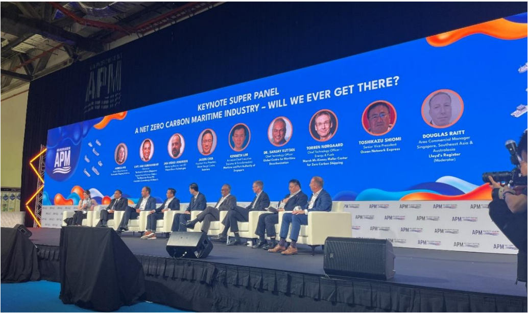
Pabel de discusión: "A NET ZERO CARBON MARITIME INDUSTRY"