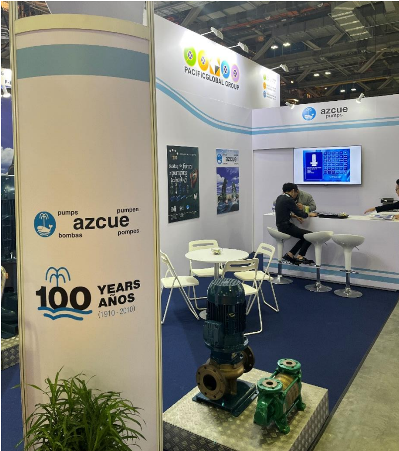
Estand de AZCUE PUMPS en espacio de PACIFIC GLOBAL GROUP.