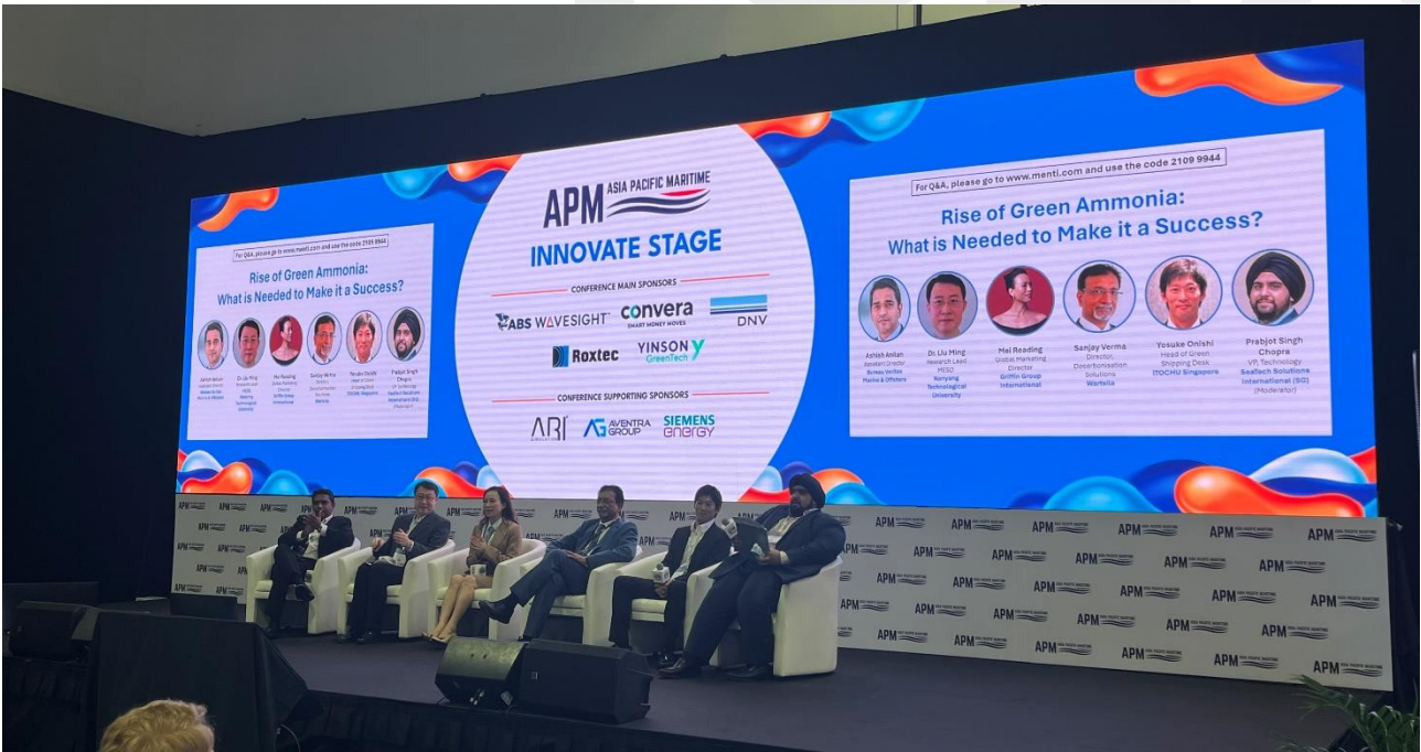
Panel de discusión "Rise of green Amonia: What is needed to make it a success?".