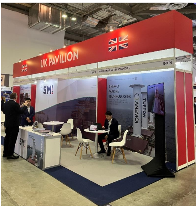
Pabellón de Reino Unido.