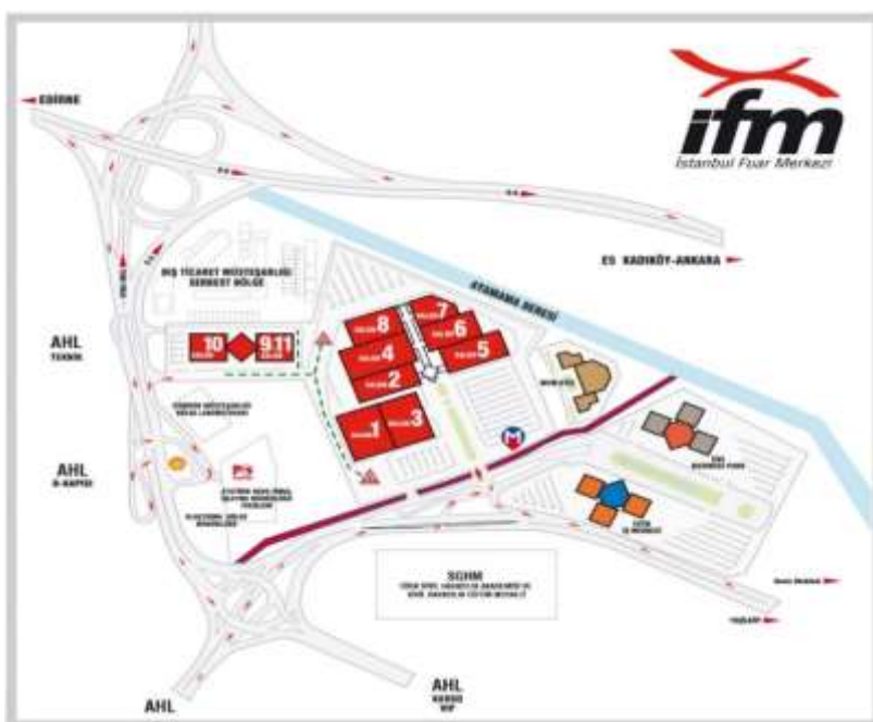
IMAGEN II: PLANO DEL ISTANBUL FUAR MERKEZI

El evento ha tenido lugar en IFM Istanbul Fuar Merkezi .